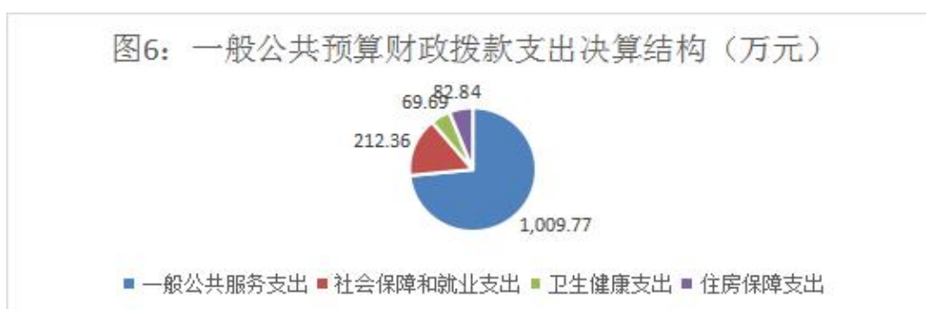
图6：一般公共预算财政拨款支出决算结构

2023年度一般公共预算财政拨款支出1374.66万元，主要用于以下方面：一般公共服务支出1009.77万元，占73.46%；社会保障和就业支出212.36万元，占15.45%；卫生健康支出69.69万元，占5.07%；住房保障支出82.84万元，占6.03%。