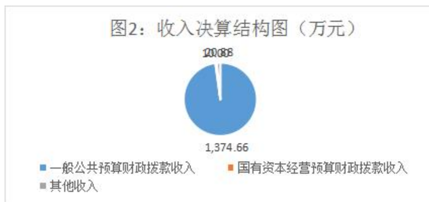
图2：收入决算结构图

2023年度本年收入合计1405.54万元，其中：一般公共预算财政拨款收入1374.66万元，占97.8%；国有资本经营预算财政拨款收入10万元，占0.71%；其他收入20.88万元，占1.49%。