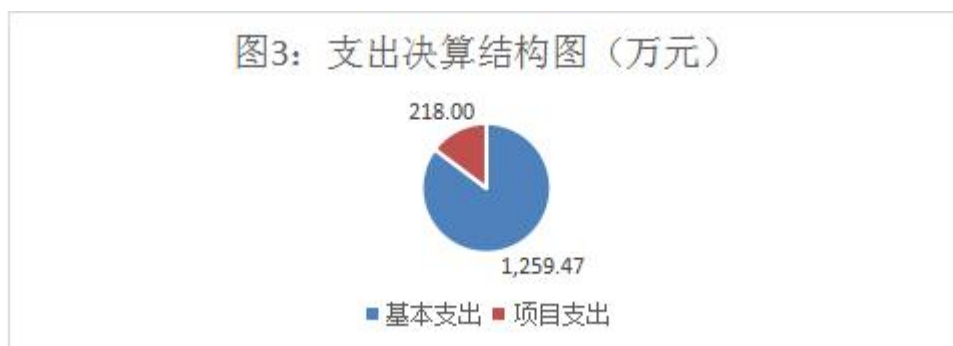
图3：支出决算结构图

2023年度本年支出合计1477.47万元，其中：基本支出1259.47万元，占85.25%；项目支出218.00万元，占13.76%。