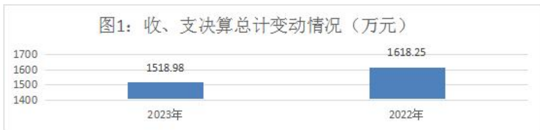
图1：收、支决算总计变动情况图

2023年度收、支总计均为1518.98万元。与2022年相比，收、支总计各减少99.27万元，下降6.13%。主要变动原因是厉行节约开支减少。