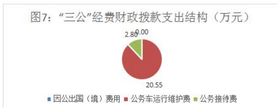
图7：“三公”经费财政拨款支出结构

1. 因公出国（境）经费支出0万元，完成预算0%。全年安排因公出国（境）团组0次，出国（境）0人。因公出国（境）支出决算比2022年增加/减少0万元，增长/下降0%。