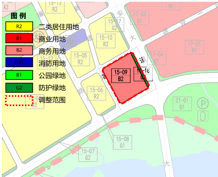
原控规土地利用规划图