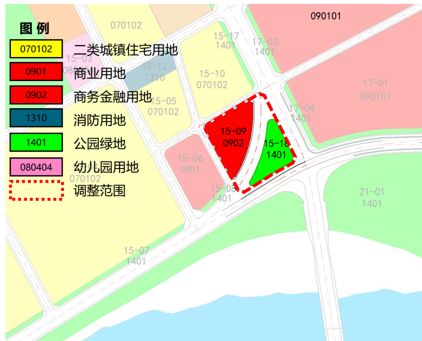
拟调整土地利用规划图