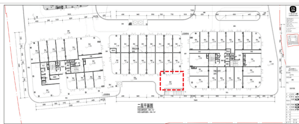
调整前二层平面图